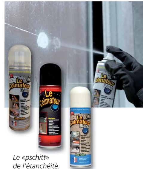
Le «pschitt» de l'étanchéité. Une fois sec il peut être peint.

Le Colmateur ajoute une nouvelle corde à l'arc de toute âme bricoleuse. Pour les néophytes, sa formule en aérosol est une motivation pour se lancer sereinement dans ce type de travaux. Et pour les bricoleurs plus avertis, Le Colmateur est garant d'une application facile pour un résultat réussi : zéro compromis sur l'étanchéité .